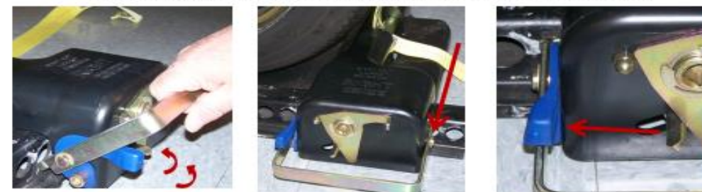
PASO 1 Desenganche: Empuje hacia adentro la Manija Azul de Bloqueo, después jale hacia arriba la Palanca Liberadora. PASO 2 Posicione: Coloque el chock Lo-Pro™ en su lugar. PASO 3 Asegure: Empuje la Palanca Liberadora hacia abajo. Asegure que la Manija Azul de Bloqueo quede por ENCIMA de la Palanca Liberadora.

Paso # 4: Repita los pasos 1, 2 y 3 para asegurar el chock Derecho al riel de amarre.